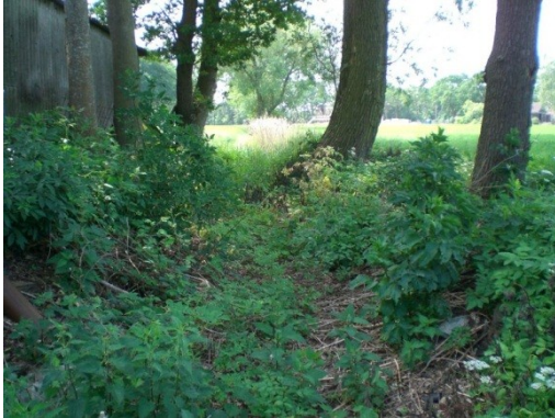
Overblijfsel van de grachte

De volgende foto's geft beelden van de huidige situatie.