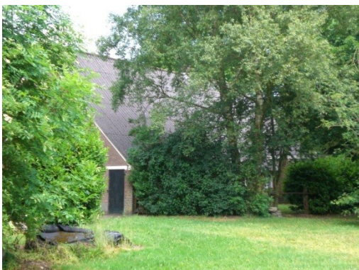
Op de plekke van t olde koetshuus is een boerderi'je ebouwd