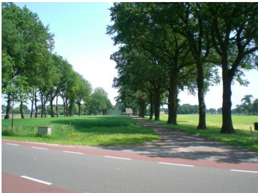
Hier lag de vroggere oprielande