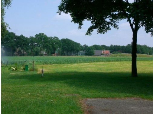
De Havezate stund midden in dit tarweveld