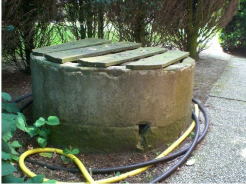
Olde waterputte van Huus Collendoorn